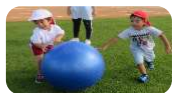
👉 幼稚園 かけっこで〜す! 大玉ころがし 『よいっしょ!』 園児も暑さに負けず、元気いっぱいです。日々成長しています。

※他の学年の様子は次号でお伝えします。 ※水筒、赤白帽子を忘れないようにお願いします。