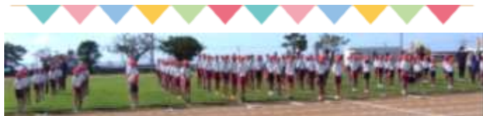
👉 第一回全体練習 整然と整列ができました!!