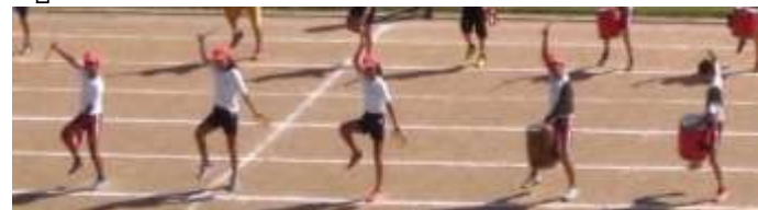
👉 5,6年生 力強く、勇壮なエイサー 精一杯、全力で、そして楽しんで…そんな5・6年生の伊江島エイサーです。青年会の方々のご指導にも感謝いたします♪