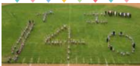
校歌ダンスを お楽しみに!